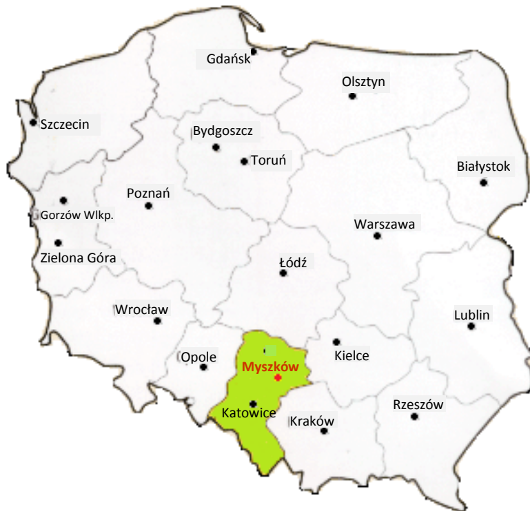
Ryc. 1 Położenie Myszkowa na tle województwa śląskiego i całego kraju.

Część obszaru miasta położona jest w otulinie Zespołu Jurajskich Parków Krajobrazowych (dzielnice: Helenówka i Bory w północno-wschodniej części miasta).